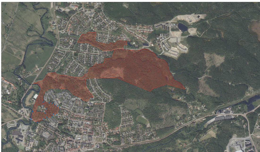
Kartbild 1. Visar Varpås rekretionsskog

Kartan och avgränsningen bör ses som ett ramverk för insatser och prioriteringar inom de närmsta 5–10 åren. Kartan ska ses över i samband med att policyn uppdateras.