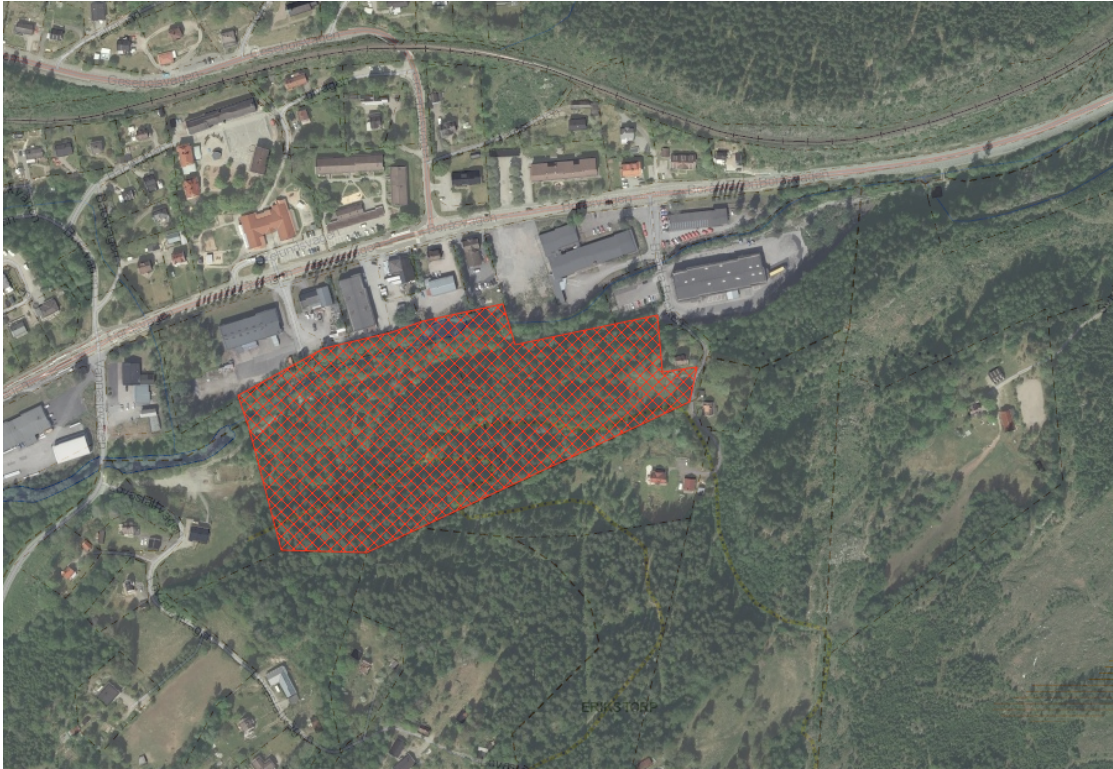
Kartbild 2. Olsfors rekreationsskogsområde

Kartan och avgränsningen bör ses som ett ramverk för insatser och prioriteringar inom de närmsta 5–10 åren. Kartan ska ses över i samband med att policyn uppdateras.